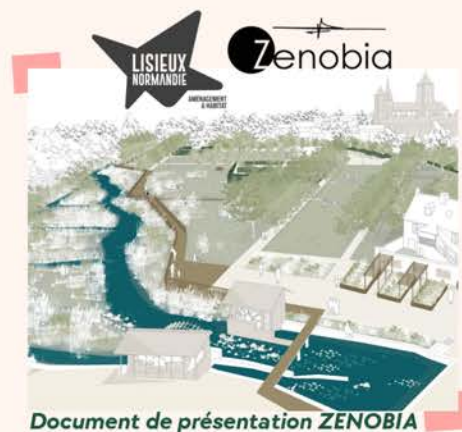
Document de présentation ZENOBIA

Coût global estimé : 1 700 000€ HT (le projet pourrait bénéficier de subventions à hauteur de 80%).